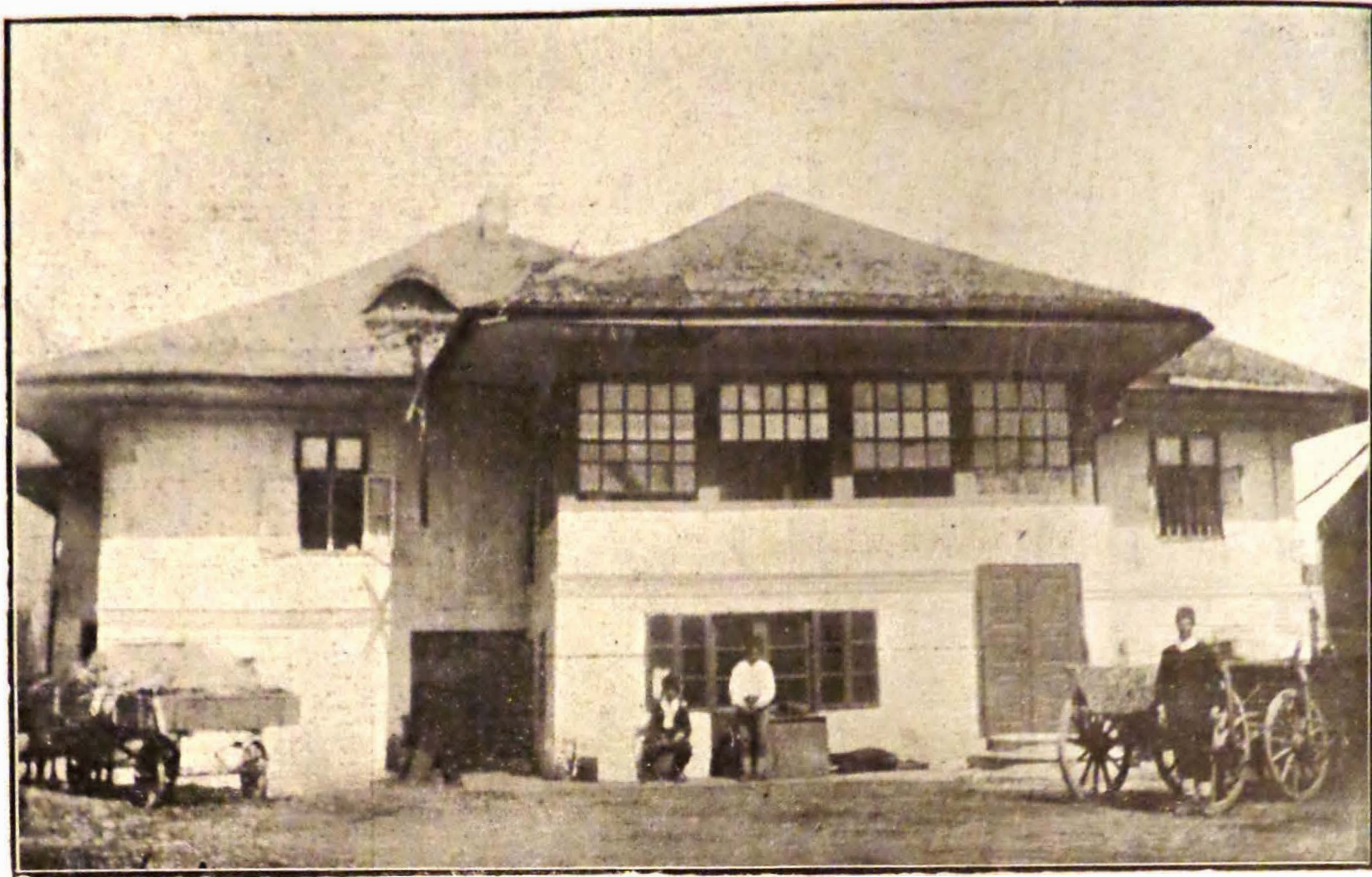
Casa din strada Labirint No. 13 fostă proprietate a d-lui Al. Ciurcu. Vedere luată înainte de dărâmare.