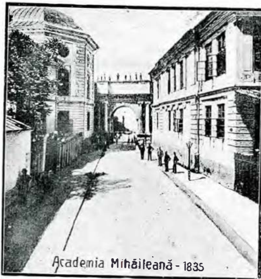
24. Arcul de triumf al fostei Academii din Iași.

„Amândouă zidurile Academiei se vor uni pe deasupra uliței, printr'un arc triumf. Lucrările se vor începe în primăvara viitoare și în puțină vreme Iașii se vor bucura de o nouă înfrumusețare“.