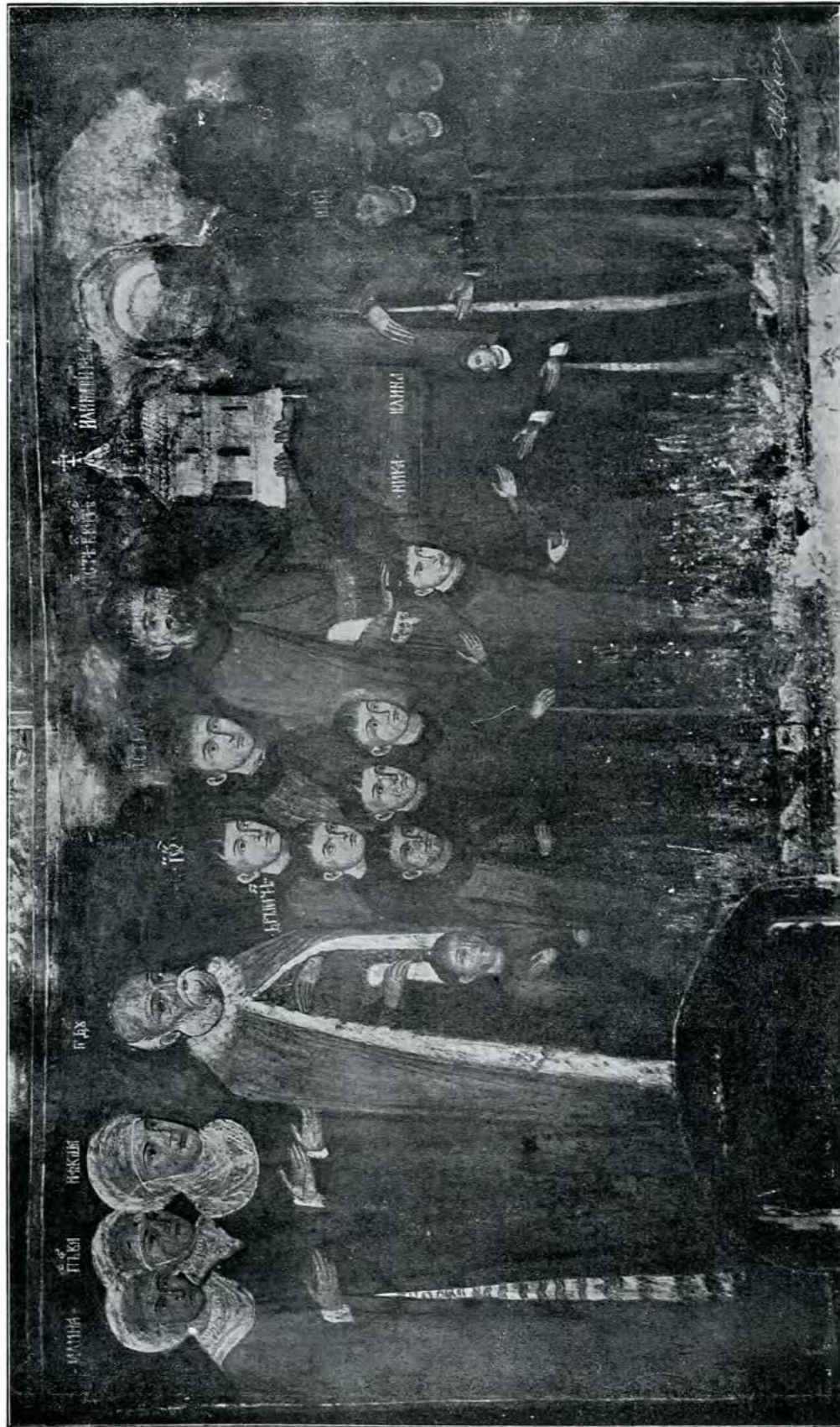
Familia ctitorului (Cârstea vel Vistier) bisericii din Popești-Vlașca.