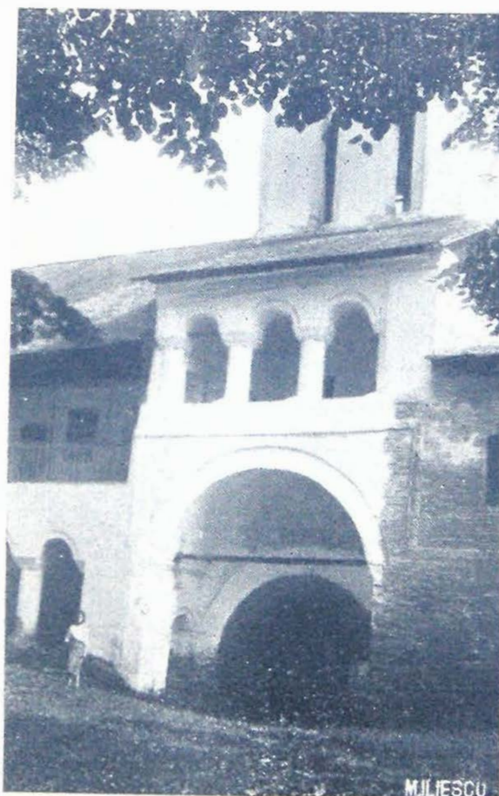
Mănăstirea Aninoasa Turnul dela intrare vedere din curte