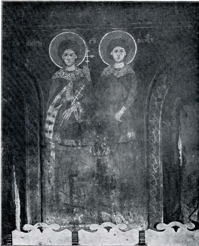
Picturi vechi (1869) în naia bisericii din Popești-Viașca.