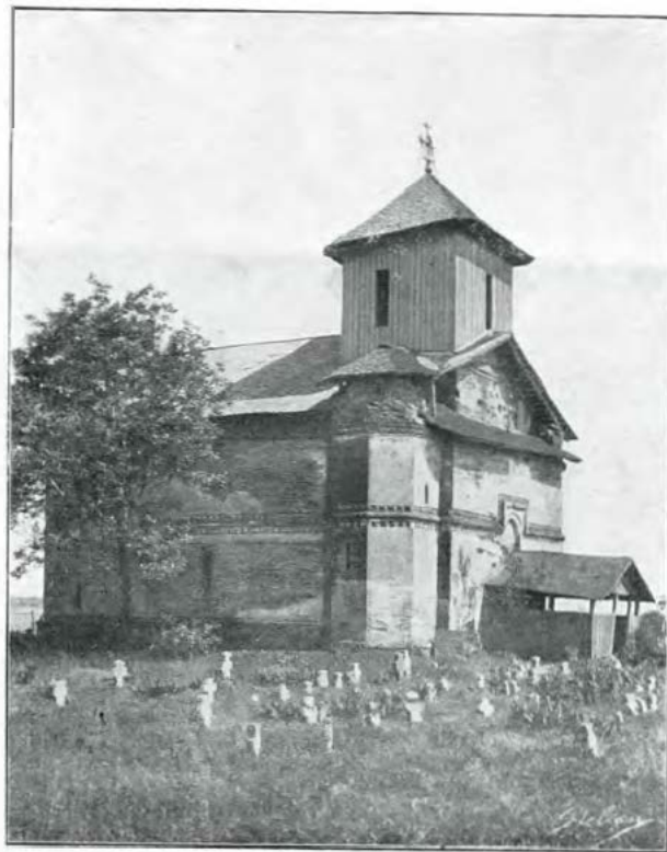
Biserica din Popești-Vlașca: vedere spre nord-vest.