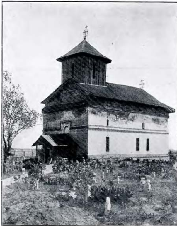
Biserica din Popești-Vlașca : vedere spre sud-vest.

interes prin structura elementelor ei organice. Astfel soclul este lucrat cu cărămizi anume rotunzite, ferestrele au rame de piatră cu arc în acoladă și cu grile de fer, iar cornișa este formată din rânduri de cărămizi așezate pe colț și pe lat, ca la mai toate ctitoriile brâncovenești, precum